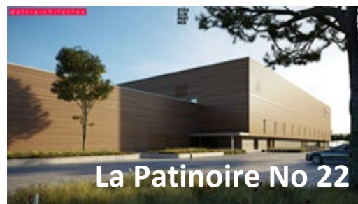
La Patinoire No 22

Syndicat intercommunal du district de Porrentruy